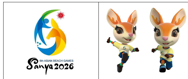
三亚 2026 年第六届 亚洲沙滩运动会 官方会徽

亚洲沙滩运动会官方会徽和官方吉祥物（如下所示）或任何其他亚洲运动会知识产权，均归亚奥理事会所有。各国家与地区奥委会仅可将其用于严格的体育或新闻报道用途，绝不得与该国家与地区奥委会自身的赞助商相关联，或用于任何其他商业用途。